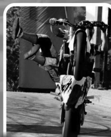
Jaque Stunt Freestyle