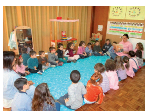
A hora do conto na sala de J. Infância

Casa da Criança Maria Rita Patrocínio Costa