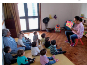
A hora do conto na sala 1 ano

A creche e o jardim de infância são um local privilegiado para a criação de leitores. Quem já não assistiu a muitos simulacros de leitura ensaiados pelas crianças? É precisamente nesta fase que é preciso oferecer-lhe livros, muitos livros, e de um bom trabalho de mediação por parte de educadores e familiares.