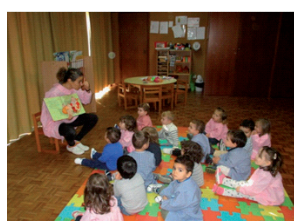
A hora do conto na sala de 2 anos