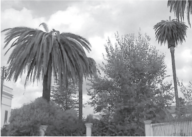
Fig. 1 – Palmeira atacada (M. Neves)