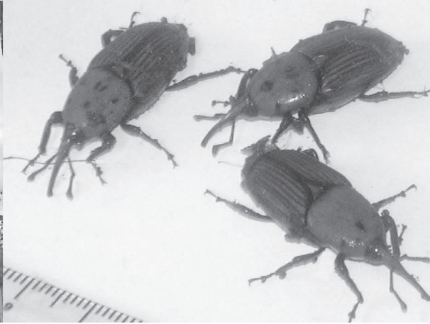
Fig. 2 – Adulto de R. ferrugineus