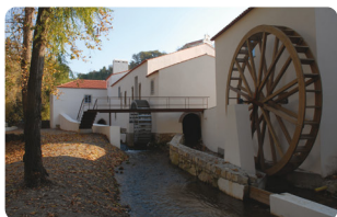
MOINHO DO PAPEL | LEIRIA