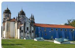
MUSEU DE LEIRIA | LEIRIA

PARA OS MUNICÍPIOS DE LEIRIA COM MAIS DE 55 ANOS